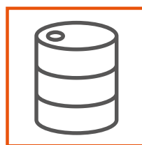
NAPRAWA BECZEK I POJEMNIKÓW